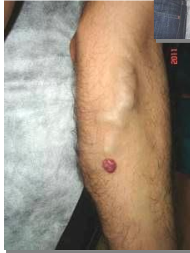
الشّكل (1): السّاعد الأيسر

لاحظ الورم الجلدي وكتلة الأوردة السطحية المتوسعة والمتخنّرة. الكتلة الوريدية تقيس 10 X 3 سم.